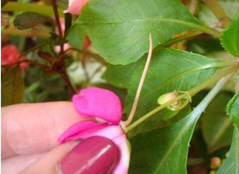
Figura 1 - Esporão (estrutura que armazena néctar)