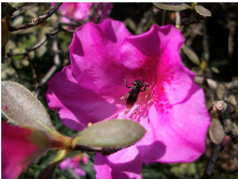
Figura 3 - Exemplo de polinização realizada por inseto

polinização e de como funcionam as “marcas” presentes nas flores (atrativo floral), ele conseguiu, em uma fotografia, traduzir seu conhecimento.