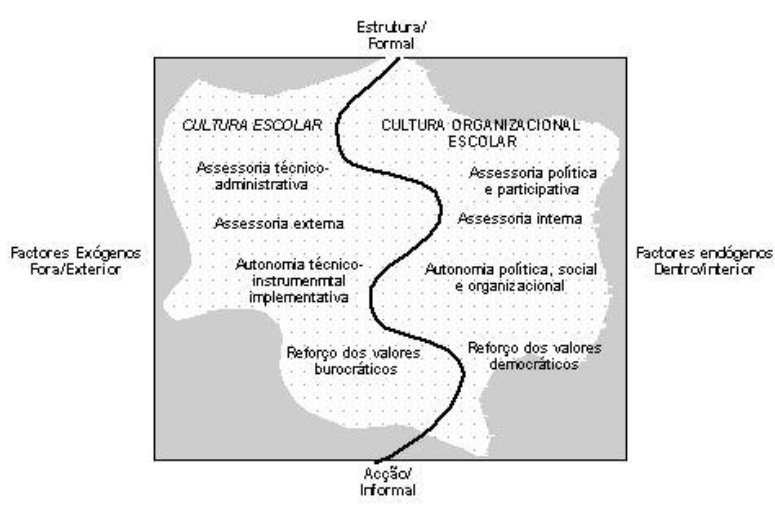
Figura 3 - Perspectivas de escola e funções da assessoria

mais democrática e autónoma, apresentamos graficamente a sinalização de duas concepções de escola antagónicas do ponto de vista político, organizacional e cultural. A primeira, situada no lado esquerdo da figura 3, pretende ilustrar uma imagem de escola relativamente cristalizada no imaginário colectivo, muito marcada pela ideia de reprodução burocrática do sistema central, um espaço que reflecte sobretudo uma cultura escolar institucionalizada, onde o centralismo e a uniformidade política, administrativa e pedagógica constituem o elemento mais marcante. Sobredeterminada exclusivamente pelos factores exógenos, esta imagem de escola articula-se com uma modalidade de assessoria de tipo externo e de cariz técnico e administrativo, centrada sobretudo no aprimoramento dos meios e das técnicas conducentes ao alcance dos resultados. Ressalta deste primeiro cenário uma assessoria centrada nos domínios mais instrumental e implementativo, aqueles que legitimam e reforçam os valores burocráticos do sistema.