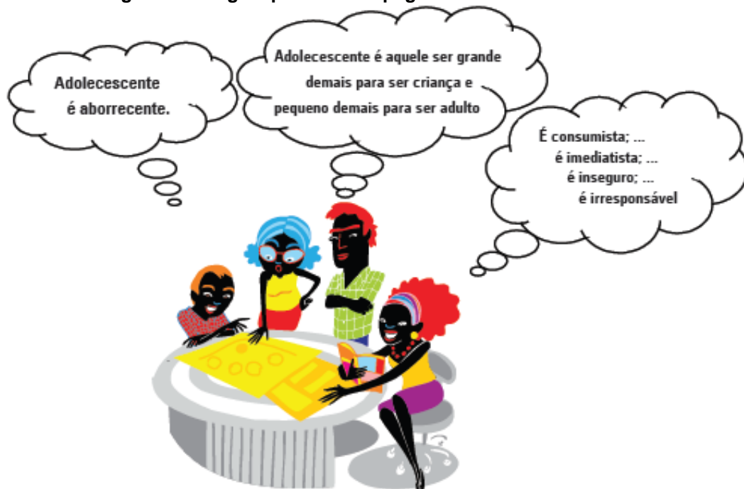
Figura 3 - Imagem presente na página 30 no Livro de Conteúdo

O que venho mencionando pode ser percebido no excerto que segue, no qual a BRASIL reconhece que o que se fala na contemporaneidade sobre o adolescente consumista, por exemplo, é um mito, uma representação “pejorativa”, como pode ser observado nos dizeres da Figura 3, que segue: