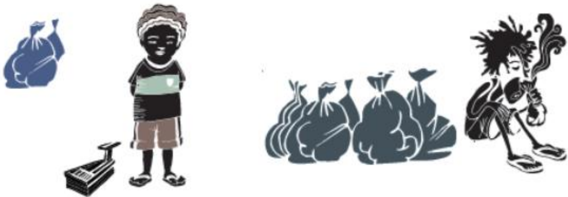
Figura 2 - Imagem presente na página 184 do Livro de Conteúdo