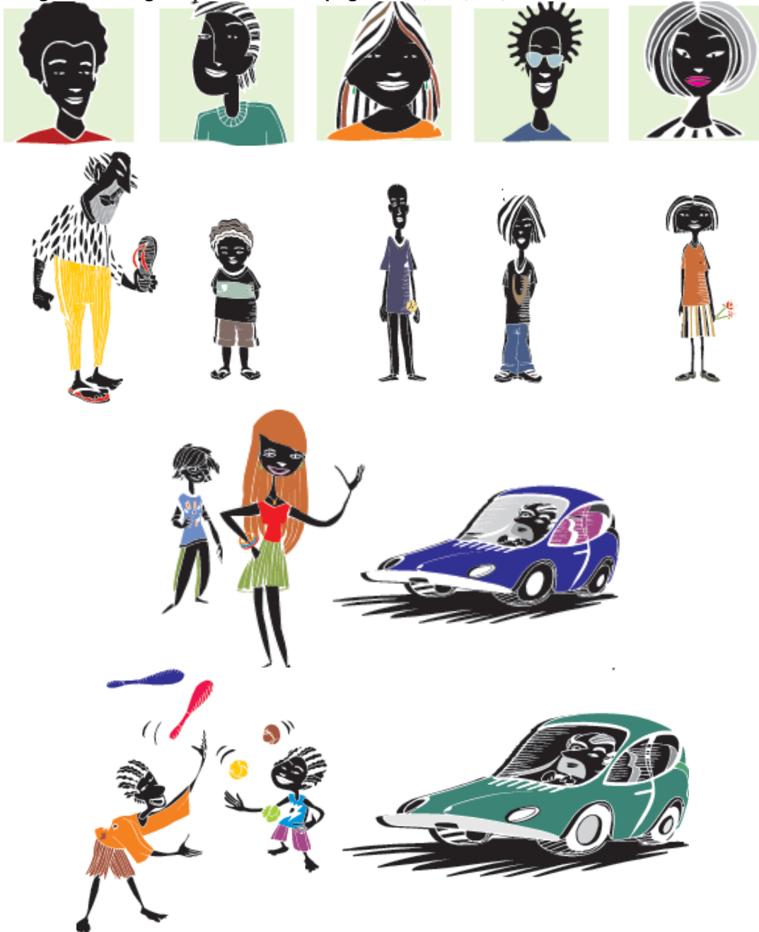
Figura 4 - Imagens presentes nas páginas 41, 184,187, 189 do Livro de Conteúdo