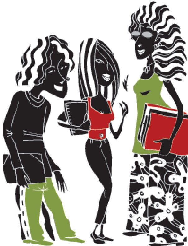
Figura 5 - Imagem presente na página 54 do Livro de Conteúdo

Devemos, portanto, trabalhar o tema da educação escolar como instrumento de dupla dimensão. Ao promover mudanças nos sujeitos e na realidade, a escola é uma instituição que serve tanto para a manutenção das relações sociais injustas quanto para a transformação dessas mesmas relações (BRASIL, 2010, p.53).