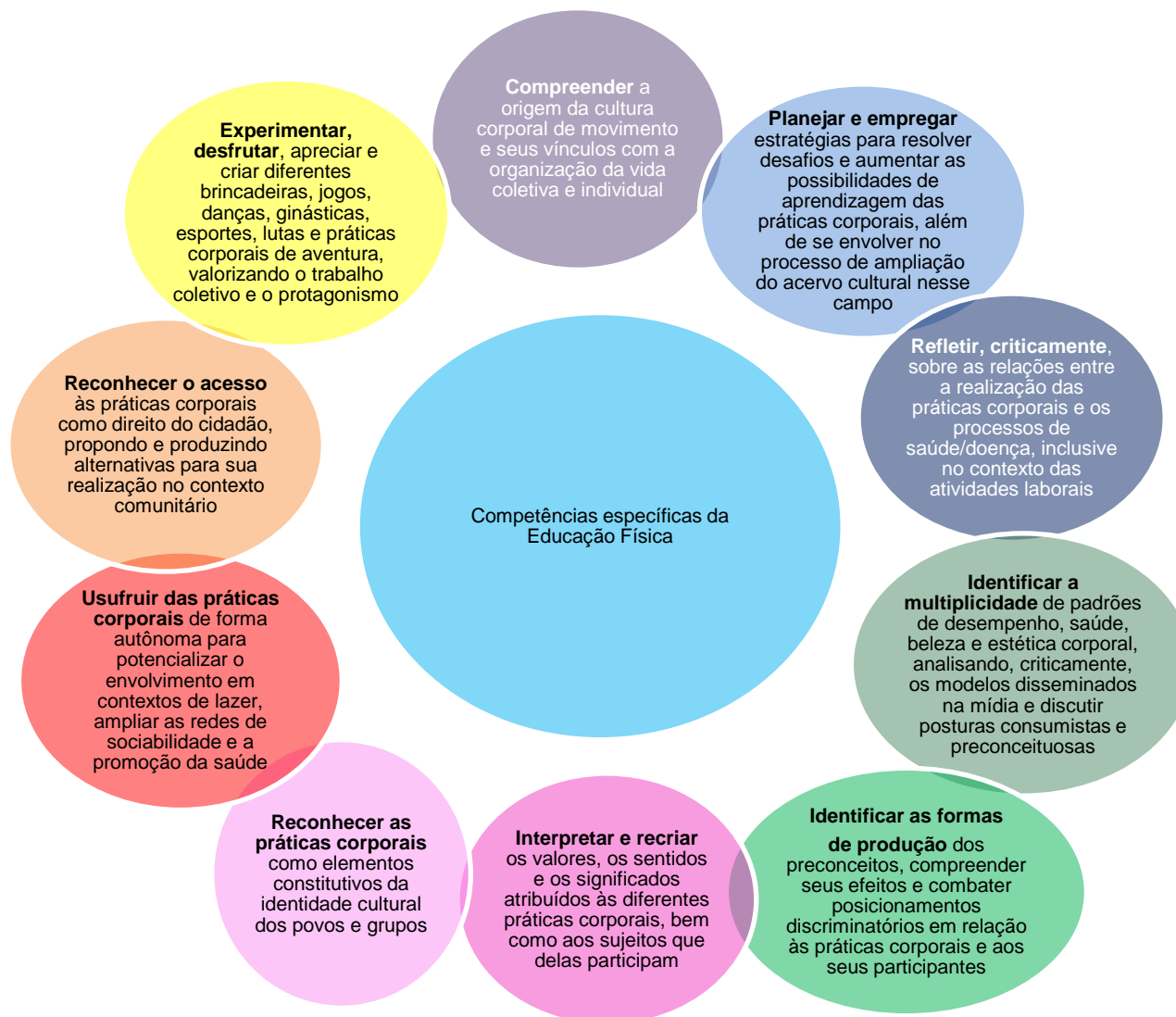
Quadro 2 das competências do Componente Educação Física: