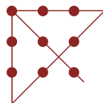
Resposta da pág. 42

Como prática social que é, a Mediação só se aprende praticando. A proposta aqui é dar uma visão geral, mas cuidadosa, desses elementos, permitindo colocar a criati-