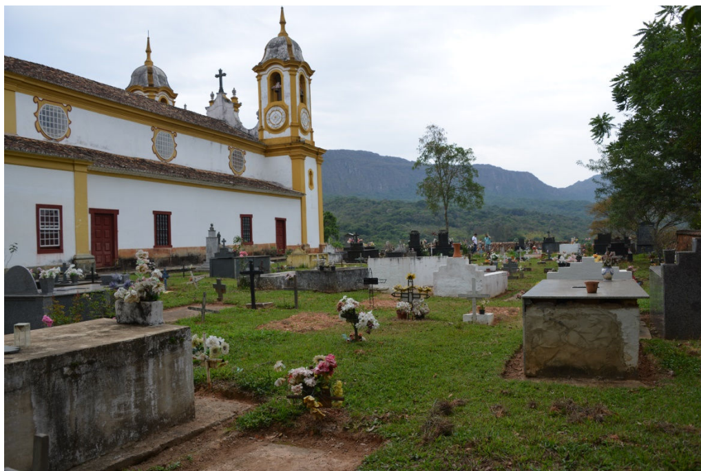
Figura 3 – Fotografia de cemitério ao lado de uma igreja em Tiradentes (MG)