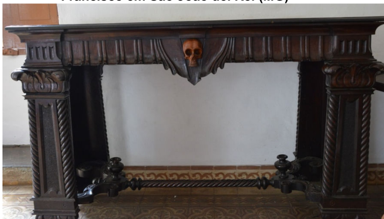
Figura 1 – Fotografia de mesa fúnebre do Século XVIII em exposição na Igreja de São Francisco em São João del Rei (MG)

No Brasil, Dias (2010) descreve que, no rito da morte, é costume que o corpo seja preparado pela funerária e enviado ao local escolhido pelos entes para ser velado. Durante o velório, que pode ser na casa do morto, no próprio cemitério no qual será enterrado ou cremado ou em velórios cedidos por órgãos municipais, o corpo permanece exposto à visitação e de lá segue o cortejo fúnebre para o cemitério, seguindo o carro que carrega o corpo. Esta exposição, muitas vezes era preparada com riqueza de detalhes, como podemos ver na Figura 1.