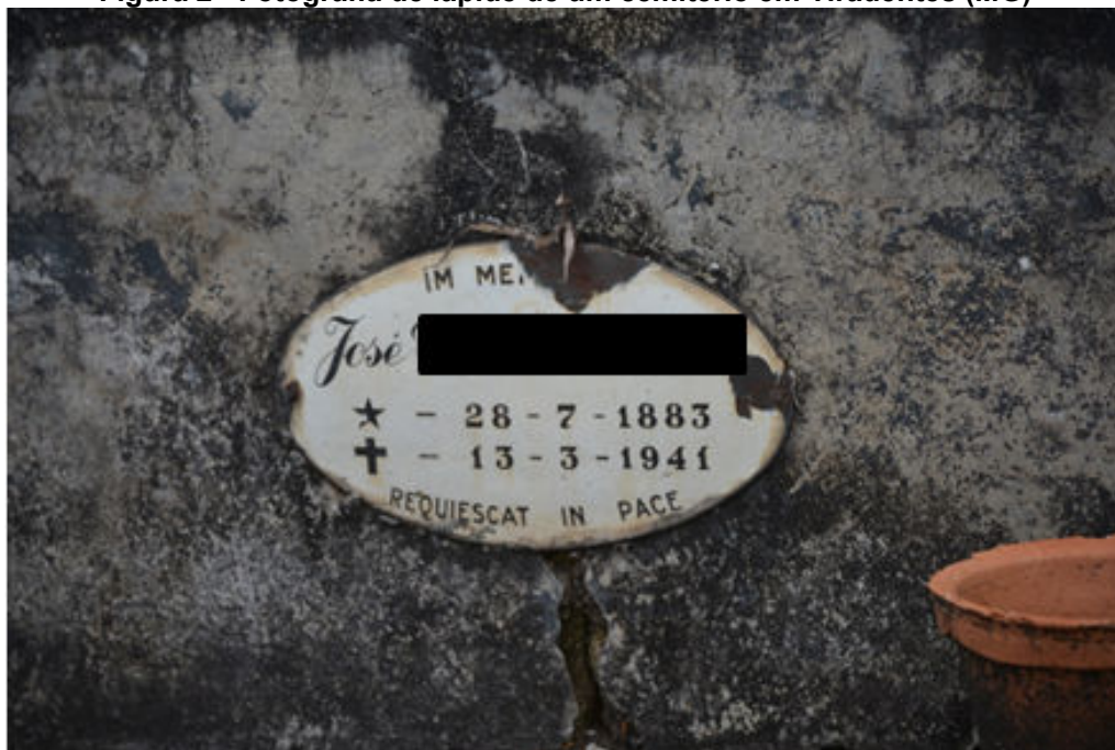
Figura 2 - Fotografia de lápide de um cemitério em Tiradentes (MG)

É devido a essa crença de sono profundo que os cristãos, de acordo com Caputo (2008), há muito tempo enterram os corpos dos defuntos com grande escrúpulo. E Silva (1993) afirma que 'Descansa em paz' é um epitáfio muito comum ainda hoje encontrado nos cemitérios, como podemos verificar na Figura 2. Aliás, a palavra 'cemitério' vem do Latim coemeterium , e do Grego koimeterion , e significa 'local de repouso', 'dormitório', também tem origem em koimao , do grego, que significa 'ponho para dormir'.