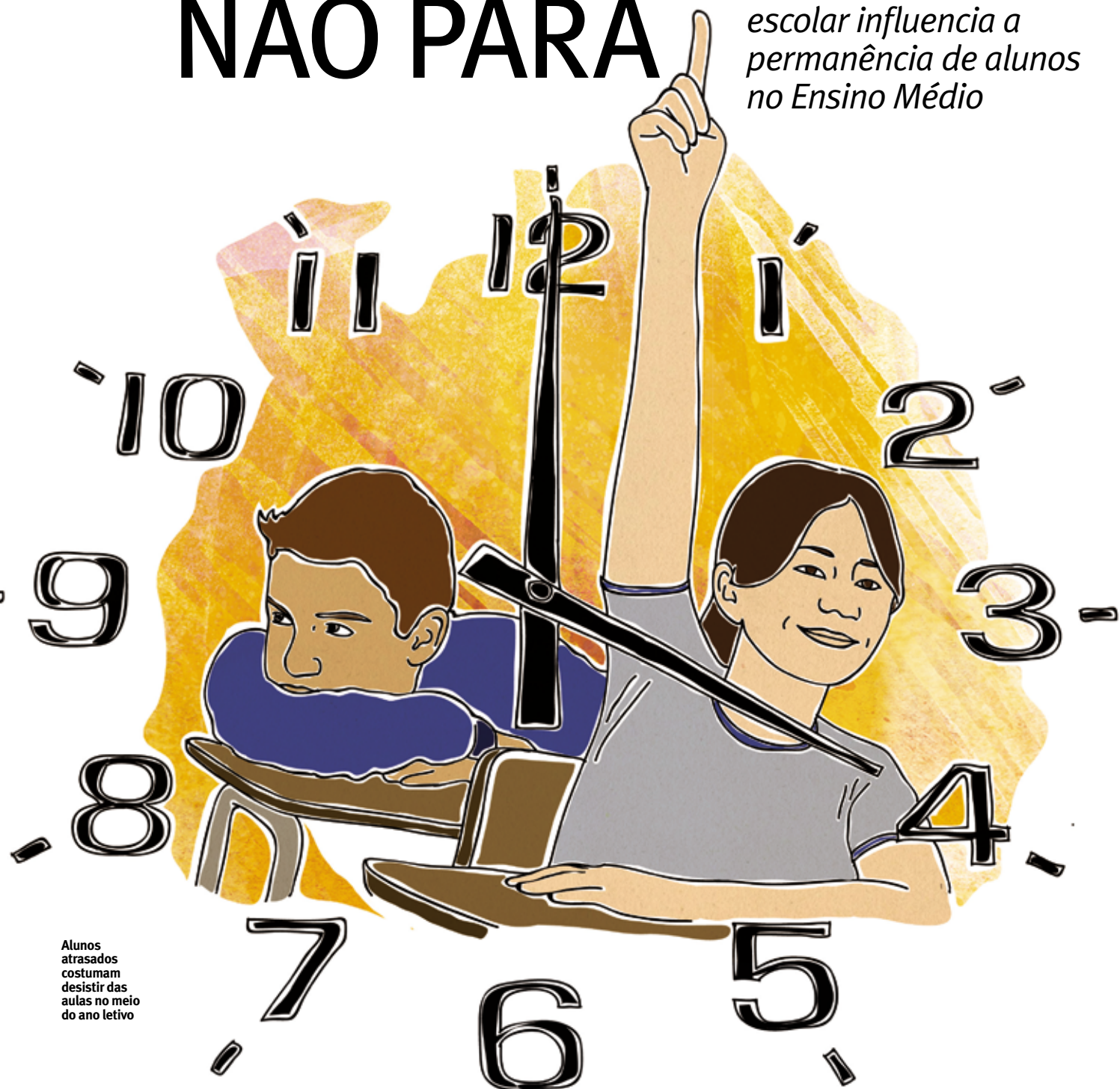
Alunos atrasados costumam desistir das aulas no meio do ano letivo

Estudo revela como a defasagem entre idade e série escolar influencia a permanência de alunos no Ensino Médio