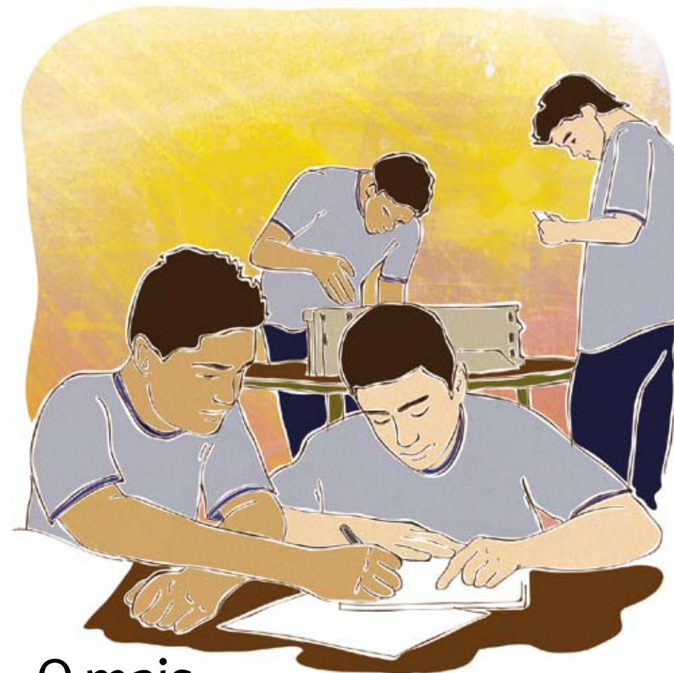
O professor deve incentivar trabalhos em grupo envolvendo estudantes com diferentes níveis de desempenho