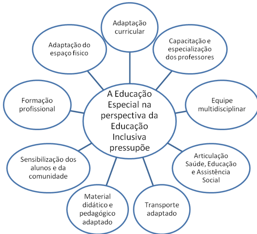
Figura 2 - Sinopse das determinações encontradas nas legislações que tratam da educação para as pessoas com deficiência no ensino regular.