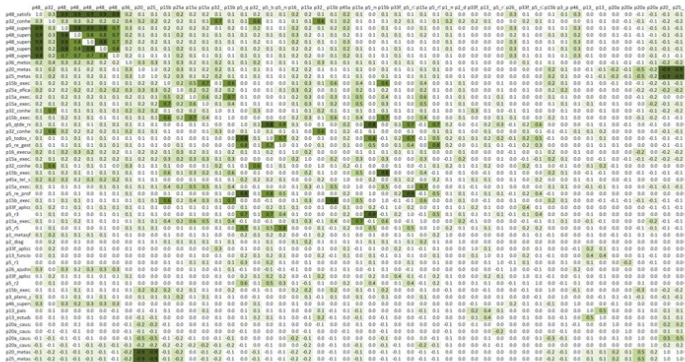
Figura 3 – Matriz de correlação reduzida, com seleção de variáveis ordenadas pelas maiores cargas fatoriais do primeiro fator