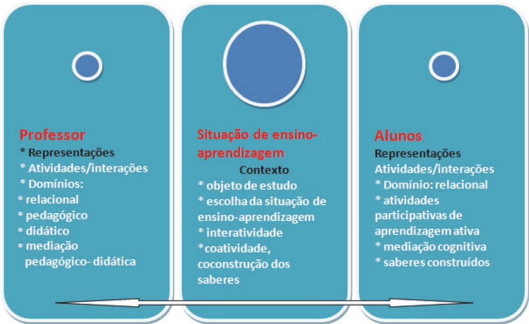
FIGURA 1 MODELO DA ARTICULAÇÃO DO PROCESSO INTERATIVO ENSINO-APRENDIZAGEM CONTEXTUALIZADO